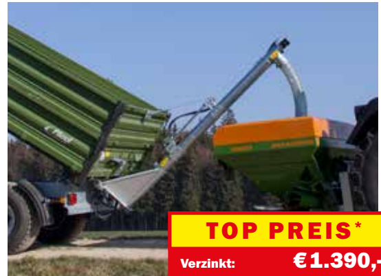
Verzinkt: AZKJFM000083 Edelstahl: AZKJFM000087