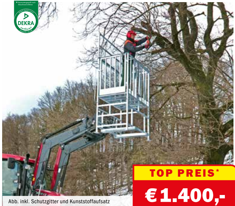
Abb. inkl. Schutzgitter und Kunststoffaufsatz