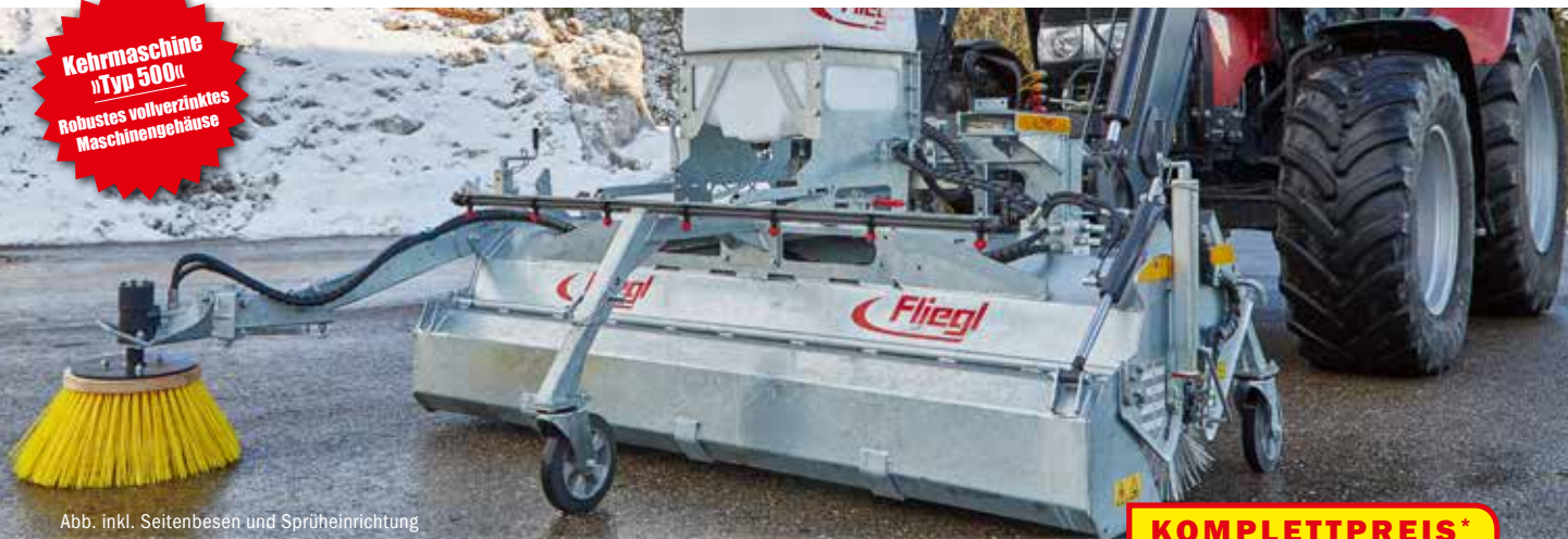
Abb. inkl. Seitenbesen und Sprüheinrichtung

Kehrmaschine »Typ 500« Robustes vollverzinktes Maschinengehäuse