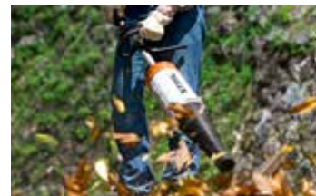
Kombiwerkzeug Blasergerät BG-KM € 176,-