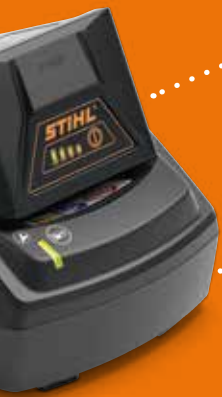
Ladegerät AL 101 € 49,-