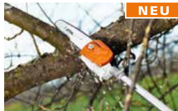
Kombiwerkzeug Hoch-Entaster HT-KM € 343,-