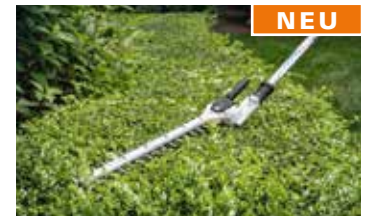
Kombiwerkzeug Heckenschneider HL-KM 145° € 403,-