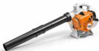
AKTION Sie sparen 40 € STIHL Benzin-Blasgerät BG 56 Hubraum..... 27,2 cm 3 Gewicht 2 ..... 4,1 kg Luftdurchsatz..... 700 m 3 /h Blaskraft 3 ..... 13 N