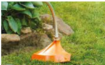
Kombiwerkzeug Freischneider FSB-KM € 69,50